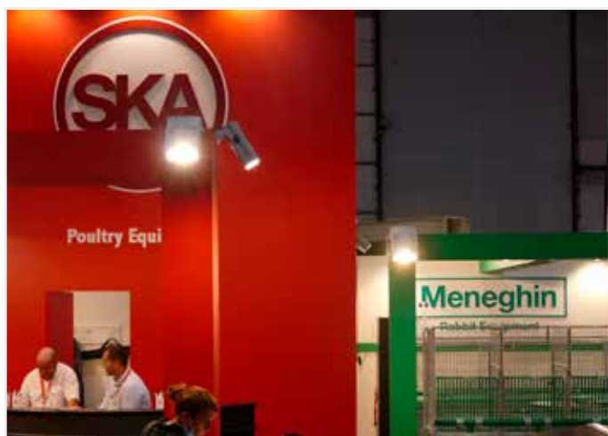
De Italiaanse constructeur van combi-parkhuisvesting voor konijnen stond er met hun laatste versie en ze zijn geïntegreerd in de SKA groep van pluimveemateriaal.