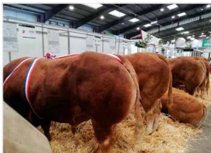
Indrukkelijk is steeds de grote hall met honderden topdieren van de vele Franse rassen.