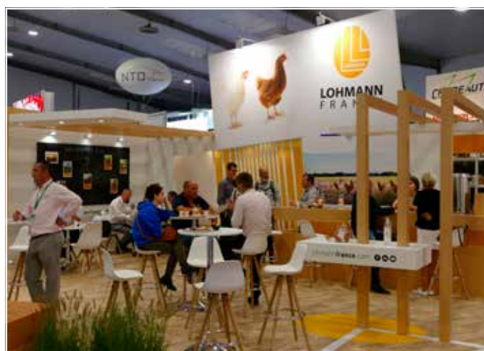
Prominent aanwezig: alle gekende selectiebedrijven voor legkippen en vleeskippen.