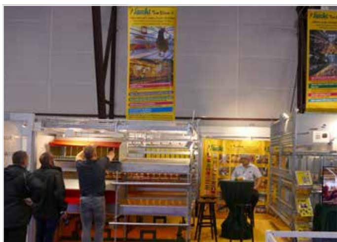
Een vaste waarde op beurzen is het Duitse Specht Ten Elsen met inrichting voor scharrelkippenstallen maar recenter ook van mobiele stallen.