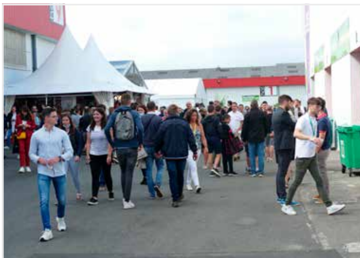
Mooi weer en veel jonge mensen bezochten de beurs.

Pluimvee (vlees + eieren) staat in voor 1/5de van de totale landbouw productiewaarde in Bretagne