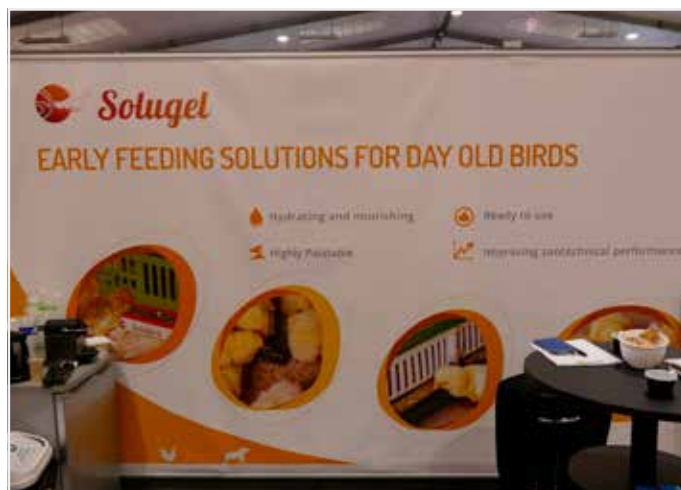
Vroege voeding van kuikens was eveneens een item op enkele standen.