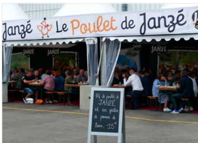
Veel foodstands tussen de hallen waaronder deze labelkippen die verkocht werden aan 15 euro voor een half kipje!