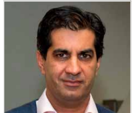
Ranjit Singh Boparan is eigenaar en CEO van de 2 Sisters Food Group, één van de Europese giganten in de pluimveesector.

"Om dit te beschouwen moeten we dit in een breder kader bekijken en rekening houden met andere argumenten. Als er rekening gehouden wordt met het internaliseren van externaliteiten (het doorberekenen van alle maatschappelijke en duurzaamheidskosten in de productie-prijzen), zoals de impact van voedselproductie op ecosystemen, milieuvuiling, natuur(behoud),... kan er inderdaad